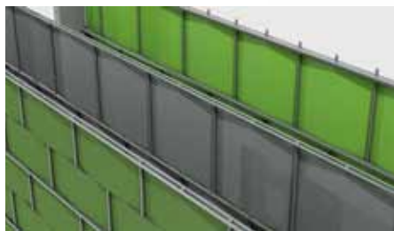
Detailansicht (Sencilo Life, Sencilo DS, Sencilo)

Der SENCILO LIFE und SENCILO DS basiert auf der bewährten Doppelstab-Gittermatte.